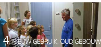
4 NIEUW GEBUIK, OUD GEBOUW

Om ook u te inspireren en wellicht te motiveren tot duurzame aanpassingen betreffende investeringen en handelen, organiseren wij op 8 november a.s. ter gelegenheid van het twintigjarig actief bestaan, een informatieavond rondom dit onderwerp specifiek voor vertegenwoordigers van sociaal maatschappelijke instellingen uit de regio. Met een inspirerende lancering door Wubbo Ockels wordt er tussen 19.00 en 22.30 uur gekeken naar welke verschillende soorten duurzame oplossingen in accommodaties, activiteiten in gedrag en technische aanpassingen, haalbaar zijn. Heeft u interesse? U kunt zich aanmelden voor deze avond op www.fondsvv.nl , onder het kopje 'Bijeenkomst duurzaamheid'.