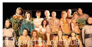
11 KUNSTEN CULTUUR