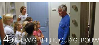
4 NIEUW GEBRUIK, OUD GEBOUW

ONDERSTAAND TREFT U EEN NAGENOEG VOLLEDIGE OPSOMMING VAN PROJECTEN AAN WAARAAN SINDS JANUARI 2011 EEN FINANCIËLE BIJDRAGE IS VERSTREKT OF TOEGEZEGD.