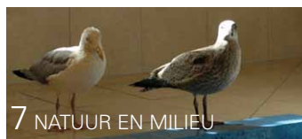
7 NATUUR EN MILIEU