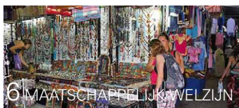
6 MAATSCHAPPELIJK WELZIJN