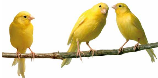
Nederlandse Kleurkanarie Club Dutch Open 2011