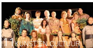
11 KUNST EN CULTUUR