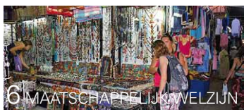
6 MAATSCHAPPELIJK WELZIJN