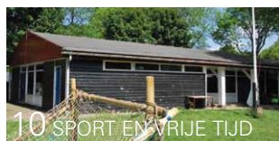
10 SPORT EN VRIJE TIJD